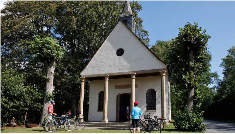
Rellerkapelle | Delbrück