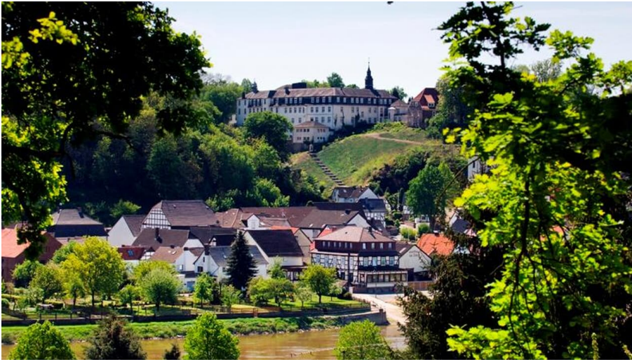
Abtei vom heiligen Kreuz, Beverungen-Herstelle