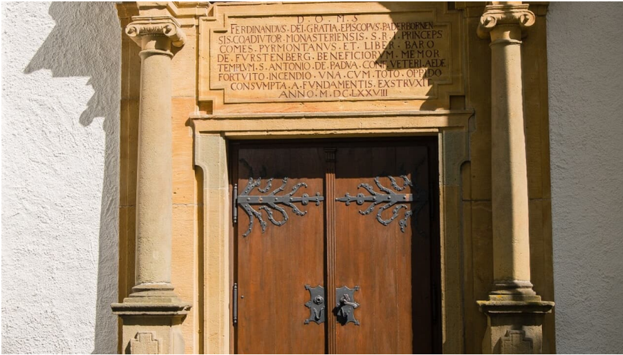
Haupteingang Kirche St. Antonius zu Padua in Bad Wünnenberg