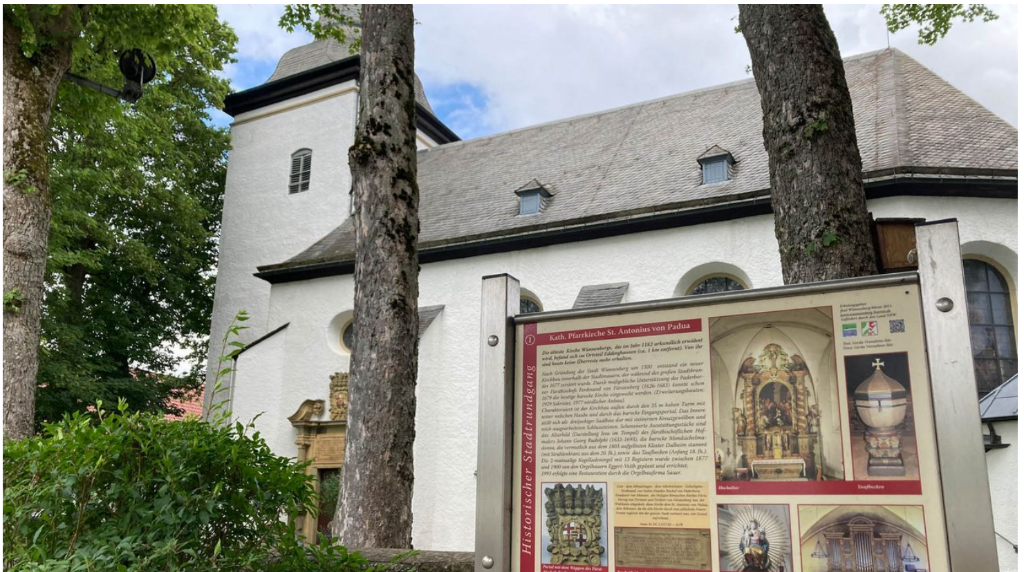
Kirche St. Antonius zu Padua | Bad Wünnenberg

Links vom Haupteingang können Sie durch die Tür im Turm in den hinteren Teil der Kirche gehen und in den Innenraum gucken.