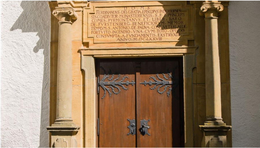
Haupteingang Kirche St. Antonius zu Padua in Bad Wünnenberg