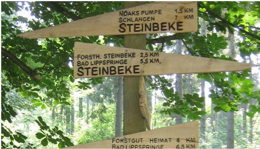
Römerbrunnen (Steinbeke) Lippspringer Wald