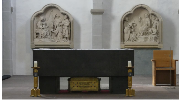
Altar in der Gaukirche mit Reliquienschein