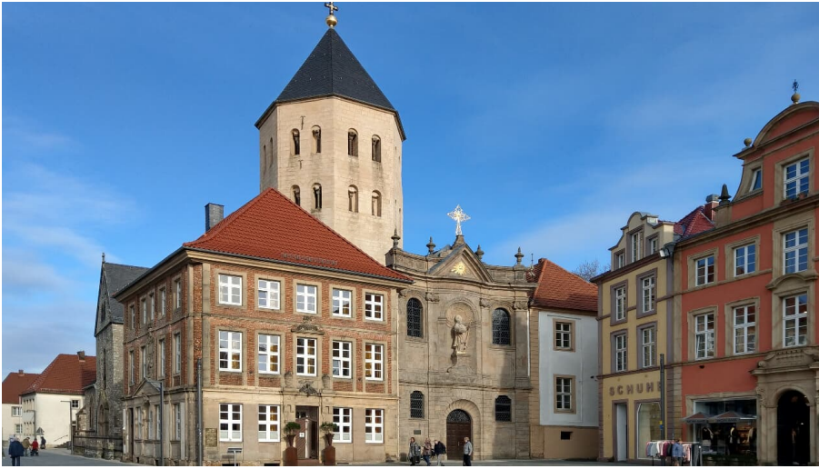
Gaukirche St. Ulrich, Paderborn