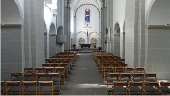
Innenansicht der Gaukirche