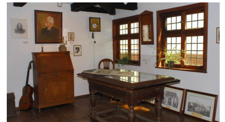
Webermuseum von Innen - © Bad Driburger Touristik GmbH