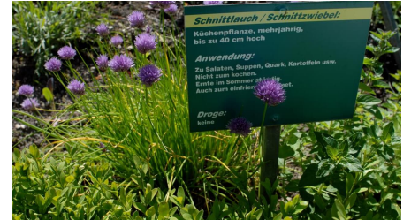
Kräutergarten Friedrich-Wilhelm-Weber-Museum