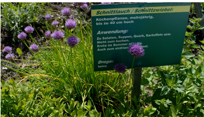
Kräutergarten Webermuseum