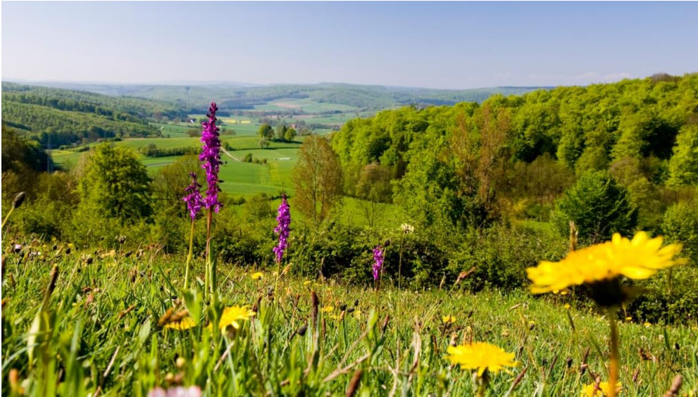
Landschaft bei Pömbesen