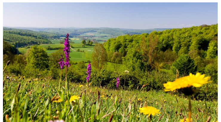
Friedrich-Wilhelm-Weber-Weg - © Bad Driburger Touristik GmbH