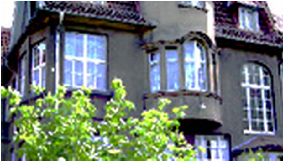
Museum Wäschefabrik