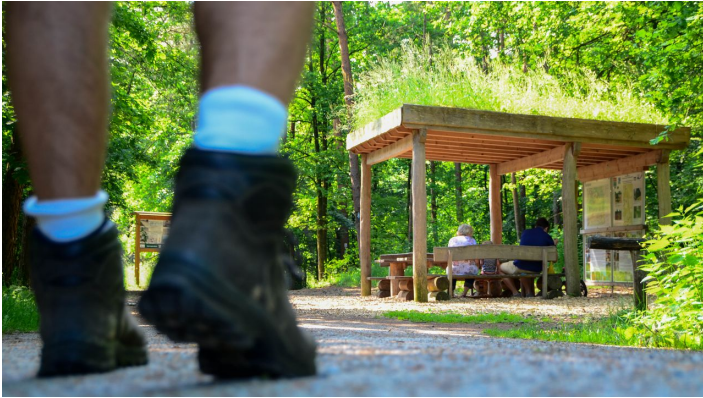
Wanderer am Schutzdach an der Emsquelle in Schloß Holte-Stukenbrock

Eintritt frei, kostenfrei / jederzeit zugänglich