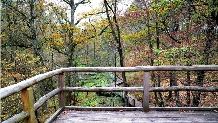
Steg oberhalb der Emsquelle in SHS