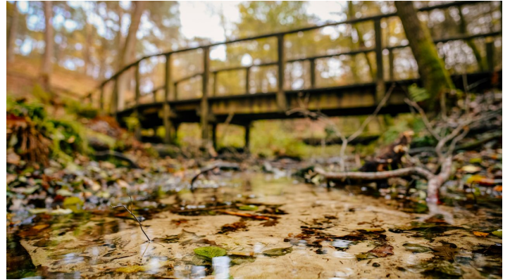
Emsquelle SHS