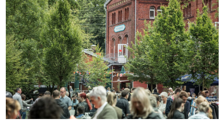
Weberlei GT - © Detlef Guethenke