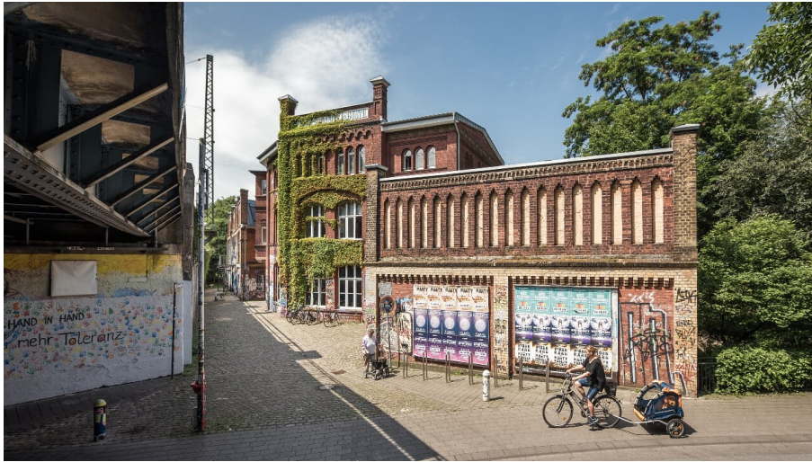
Weiberei Gütersloh