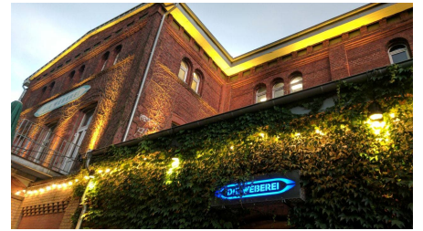
Die Weberlei