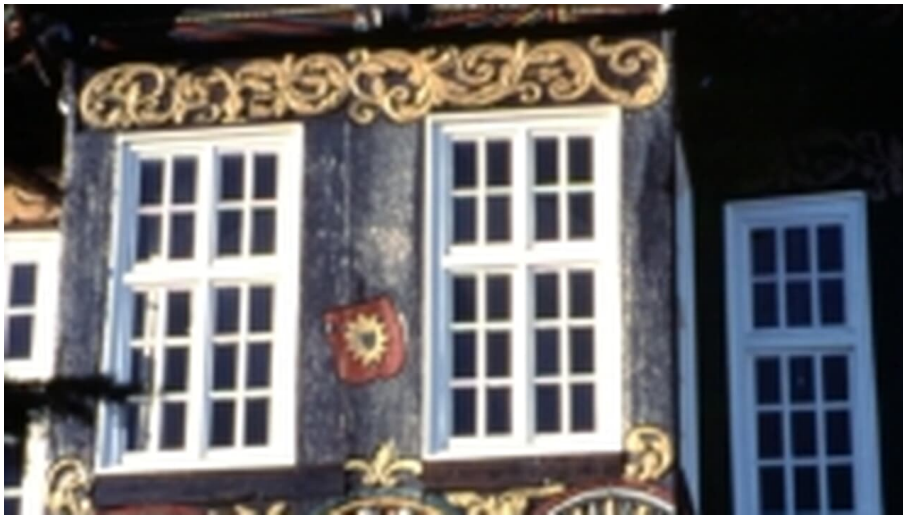
Fachwerkdetail Blomberg