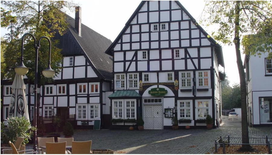
Fachwerk am Doktorplatz in Rheda