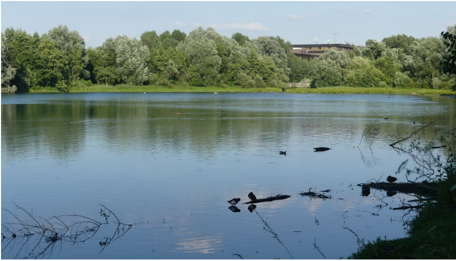
Padersee mit HeinzNixdorf MuseumsForum