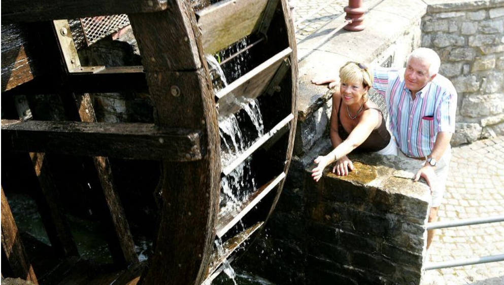
Paar am Mühlrad