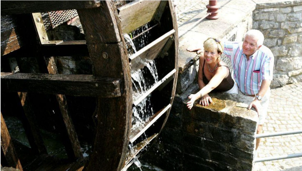
Paar am Mühlrad