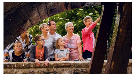
Stadtführung entlang der Mühlenforte in Bad Driburg