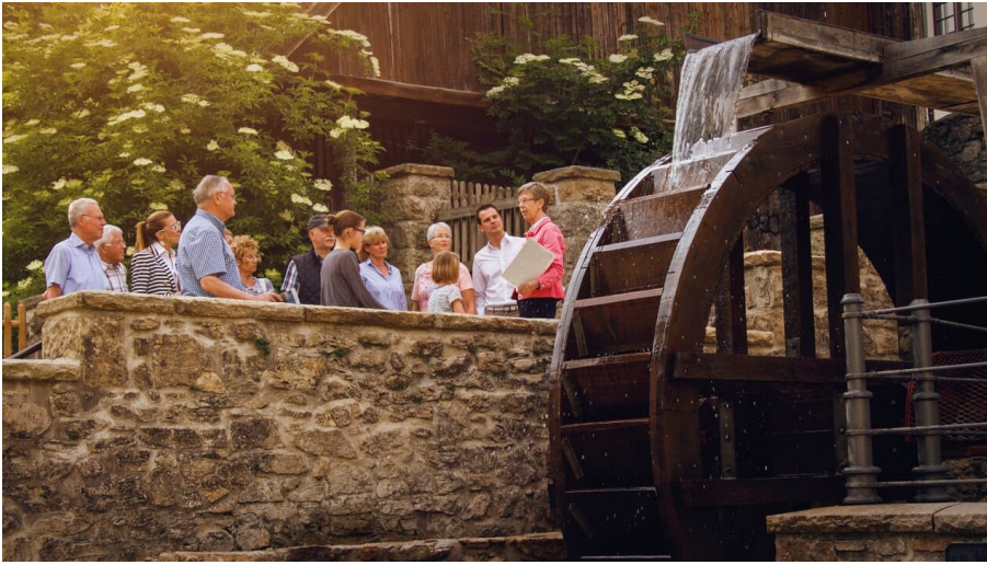
Mühlenpforte in der Bad Driburger Innenstadt

Die Mühlenpforte inmitten der Innenstadt Bad Driburgs erinnert an eine der ältesten Mühlen der Stadt. Seit 2019 lockt ein Abenteuerspielplatz Familien auf dem Vorplatz der alten Mühle.