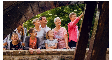
Stadtführung entlang der Mühlenforte in Bad Driburg