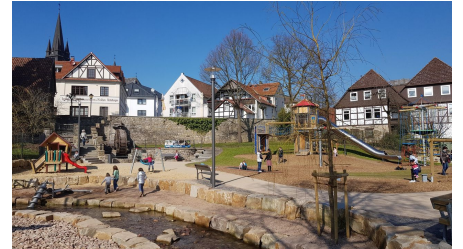
Bad Driburg - Abenteuerspielplatz am Mühlrad