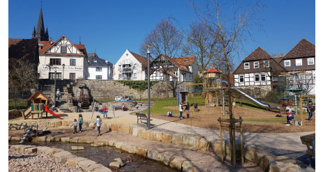
Bad Driburg - Abenteuerspielplatz am Mühlrad