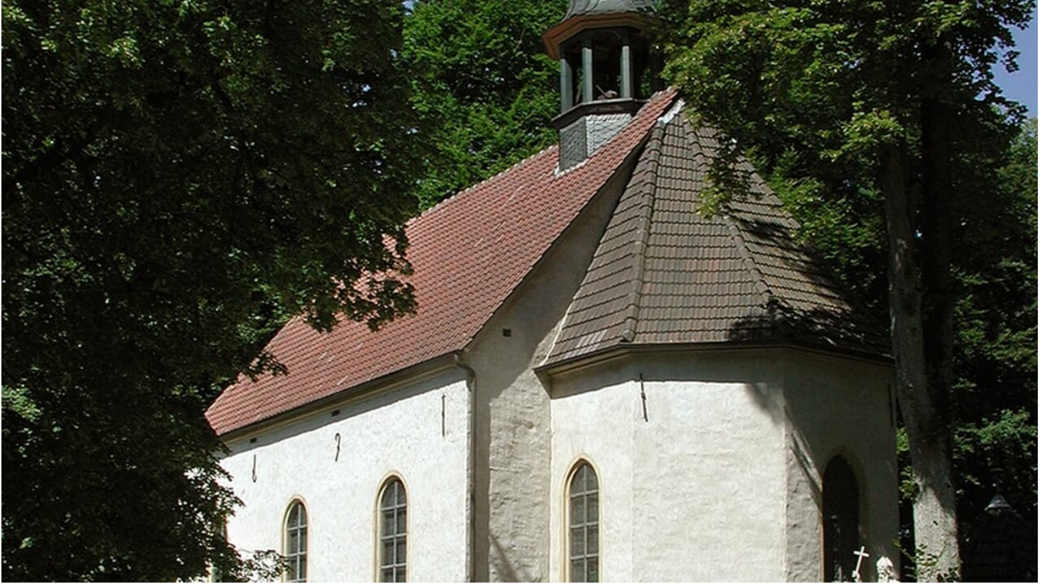
Halle Westfalen, idyllische Pfarrkirche Stockkämpen im Ortsteil Hörste