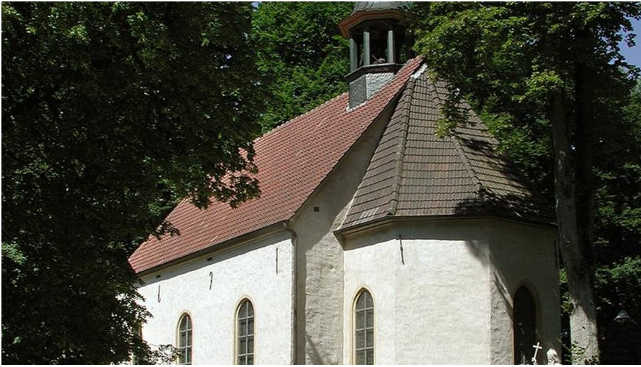
Halle Westfalen, idyllische Pfarrkirche Stockkämpfen im Haller Ortsteil Hörste