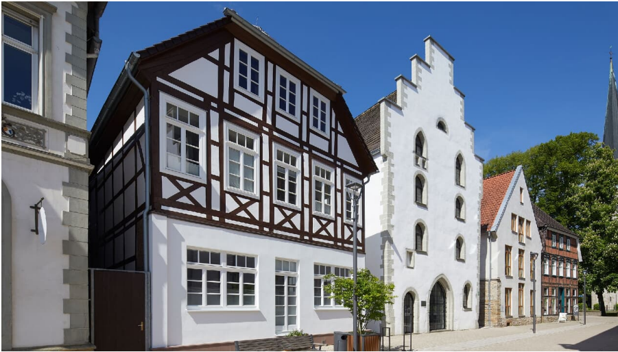
Alte Waage