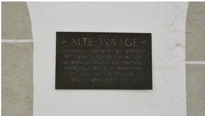
Alte Waage