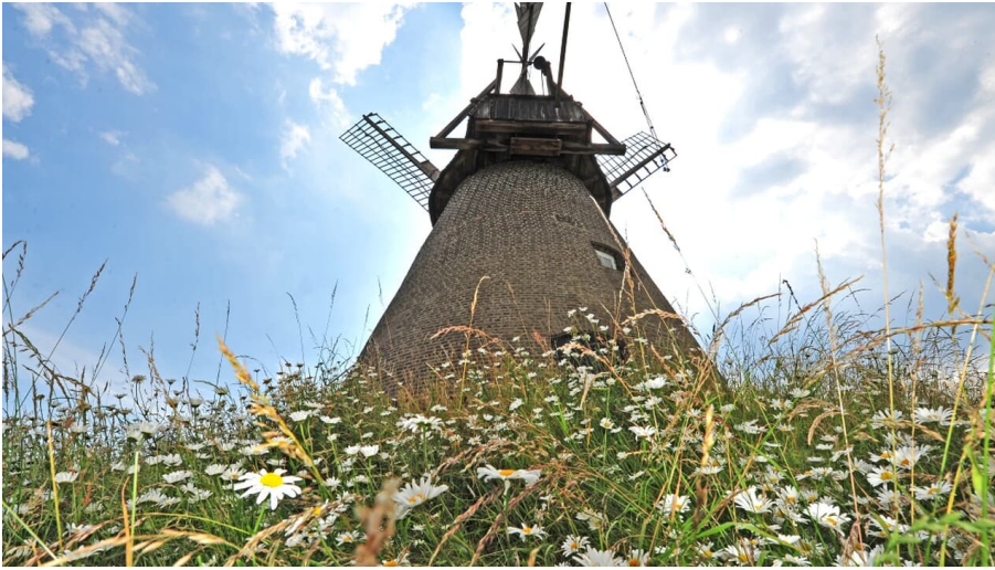
Windmühle Südhemmern 2