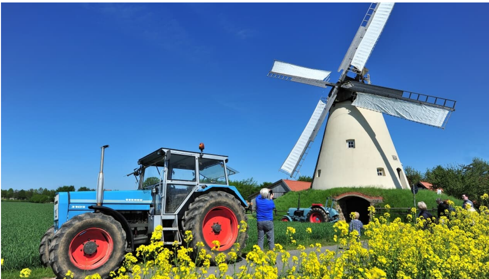
Windmühle Südhemmern 1