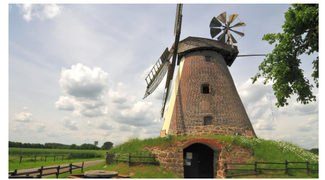
Windmühle Südhemmern