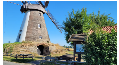
Windmühle Südhemmern