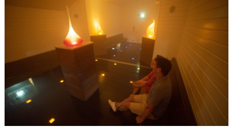
Staatsbad Salzuflen GmbH