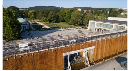
Staatsbad Salzuflen GmbH