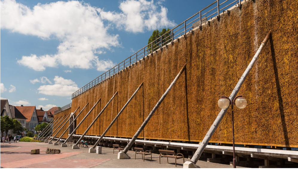
Teutoburger Wald Tourismus, D. Ketz