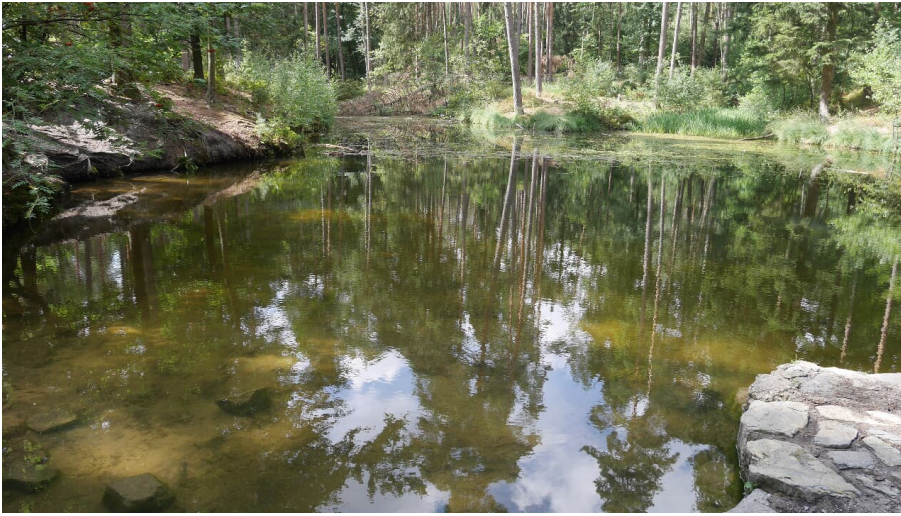
Blauer See