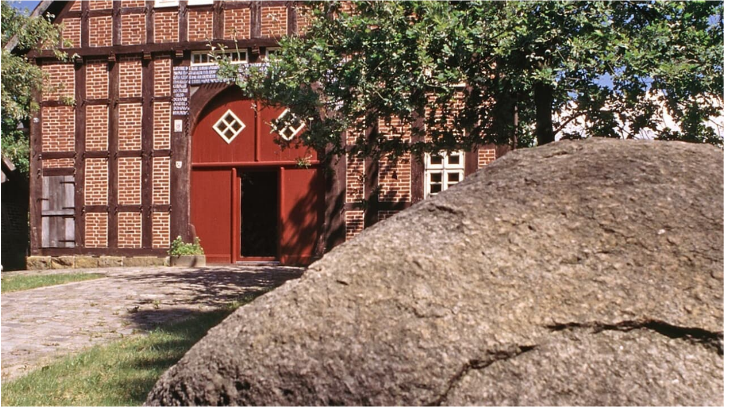
Handwerkerhaus Museumshof Senne