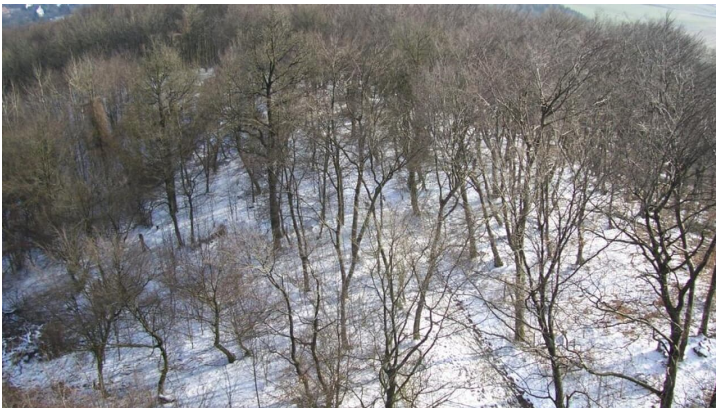
Aussicht im Winter vom Luisenturm Borgholzhausen - © Ina Bohlken, Teutoburger Wald Tourismus / OstWestfalenLippe GmbH