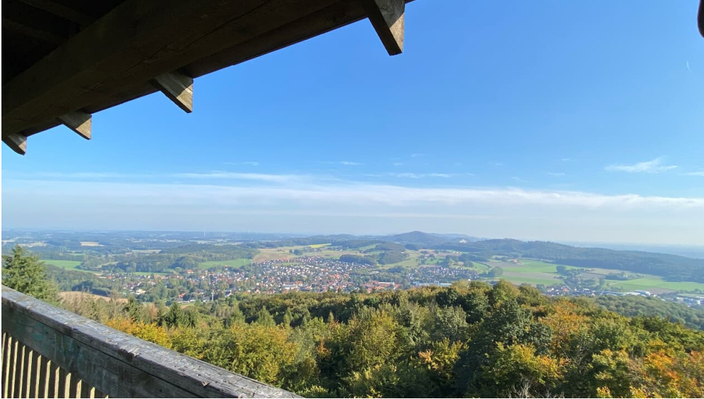
Blick vom Luisenturm