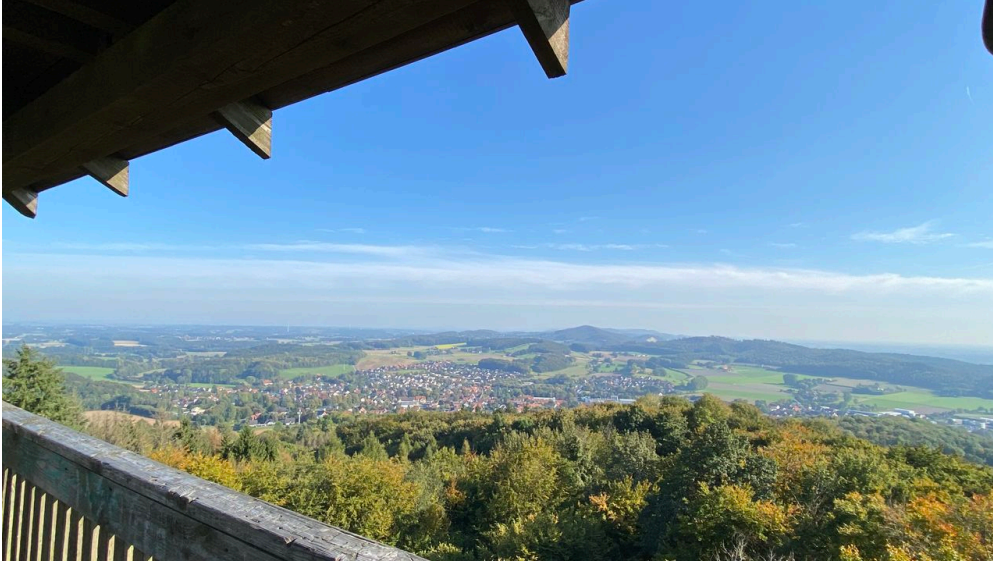
Blick vom Luisenturm