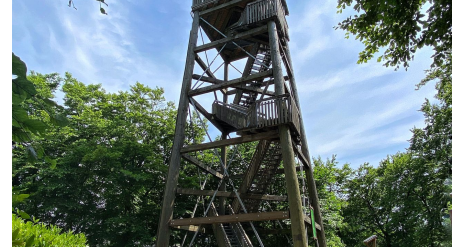
Luisenturm im Sommer