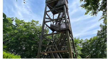
Luisenturm im Sommer