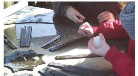
Kinder am Richtungswaiser, Luisenturm Borgholzhausen - © Ina Bohlken, Teutoburger Wald Tourismus / OstWestfalenLippe GmbH