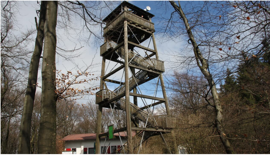
Luisenturm Borgholzhausen