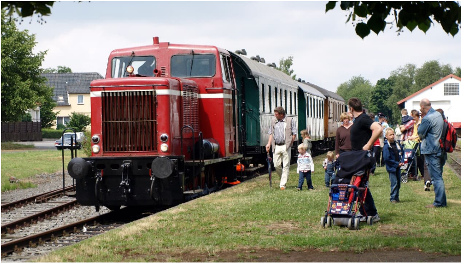
Museumseisenbahn Minden