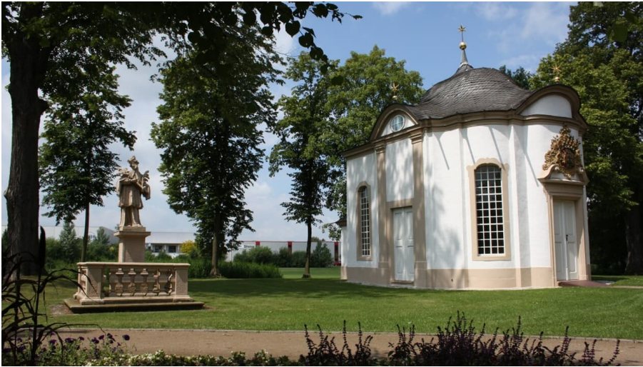
Johanneskapelle Rietberg