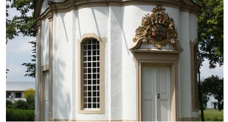
Johanneskapelle - © Stadt Rietberg