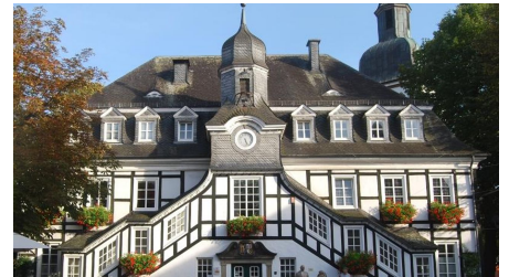
Historisches Rathaus