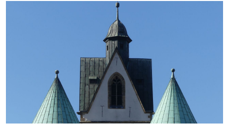
Turmspitzen der Busdorfkirche