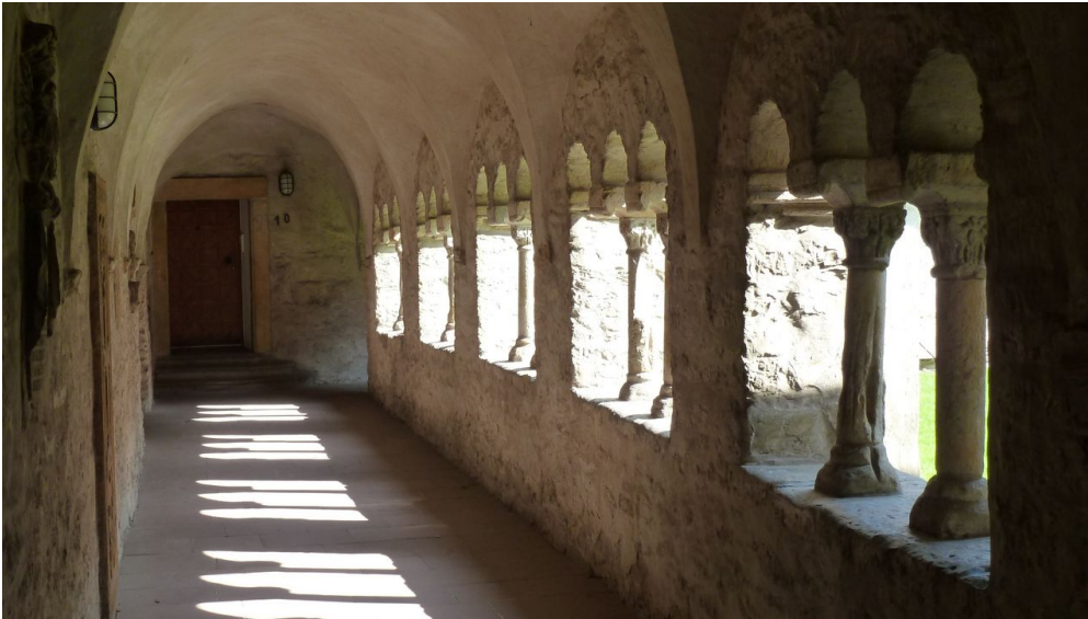
Kreuzgang (Pürting) der Busdorfkirche