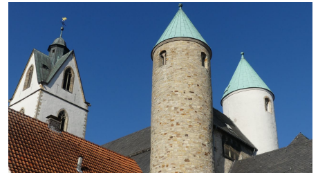
Türme der Busdorfkirche