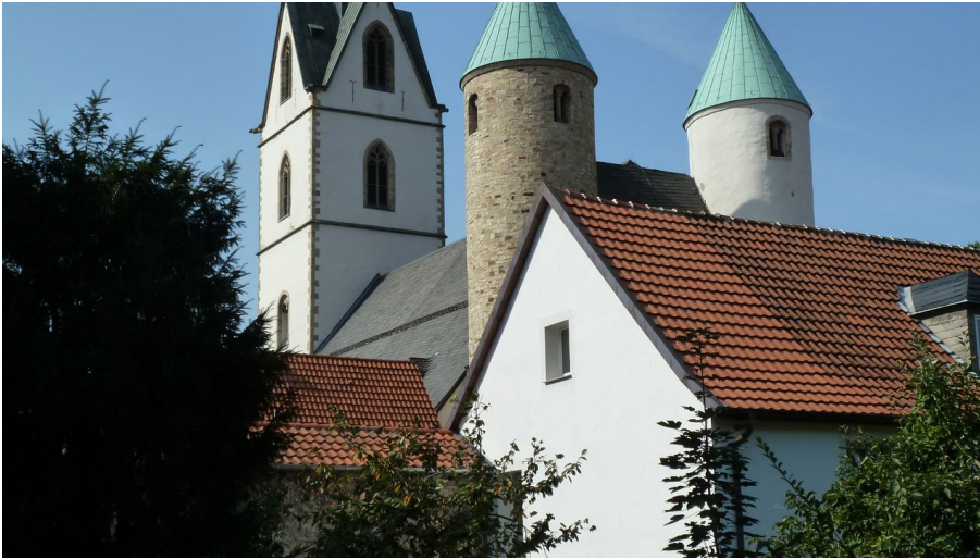
Busdorfkirche - © Karl Heinz Schäfer, Tourist Information Paderborn / Verkehrsverein Paderborn e.V.