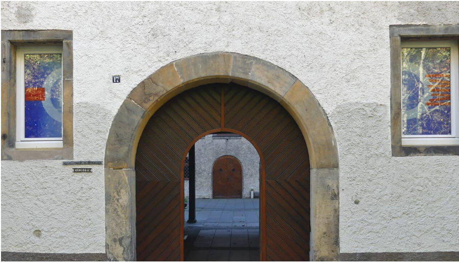
Eingang Michaelskloster