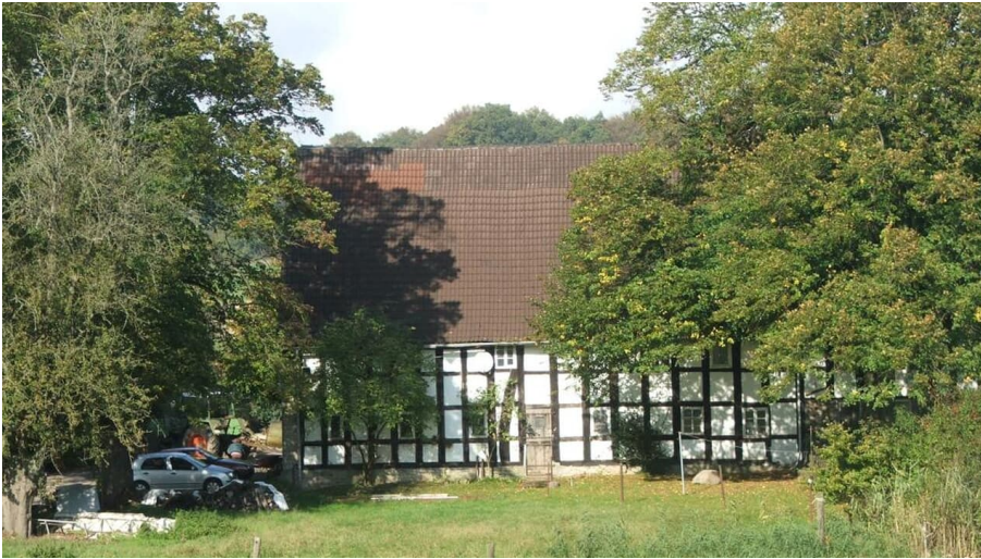
Hof Geers