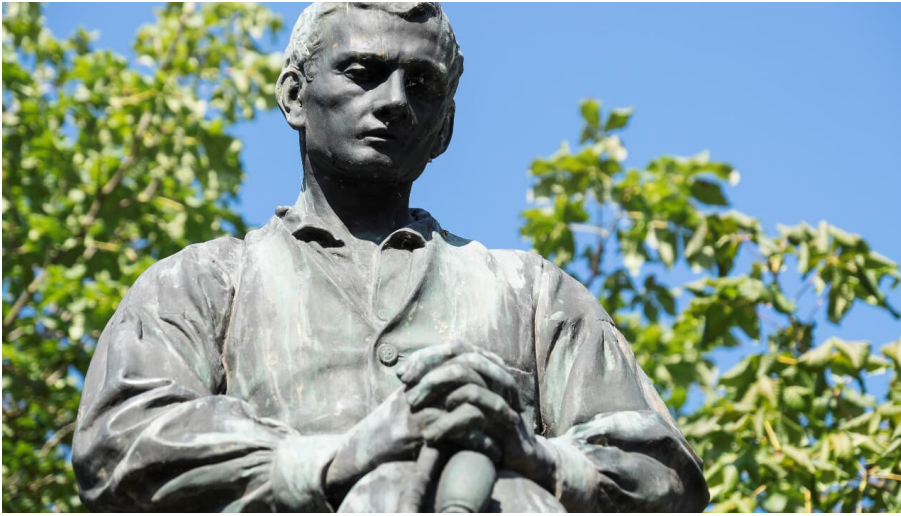
Denkmal Betender Landmann, Marktplatz Wiedenbrück