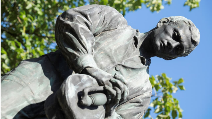
14-08 14-08 Rheda-Wiedenbrück-1667.jpg

Quelle: destination.one ID: p_100038916 Zuletzt geändert am 01.04.2022, 09:04