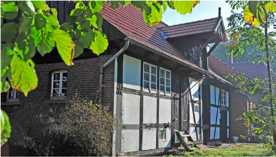
Ellerburger Mühle