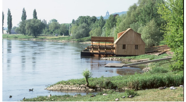
Schiffmühle Minden