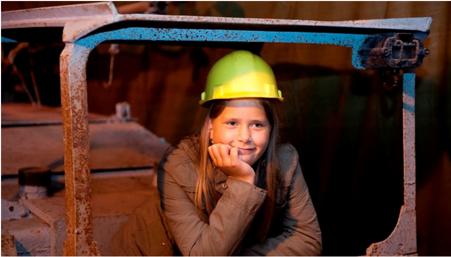
Besucherbergwerk Kleinenbremen