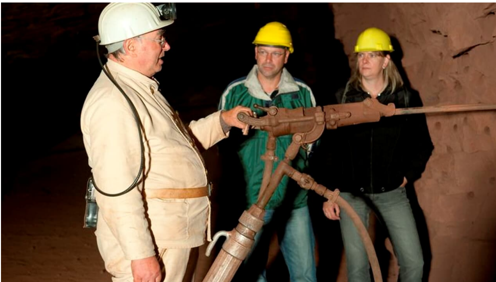
Besucherbergwerk Kleinenbremen