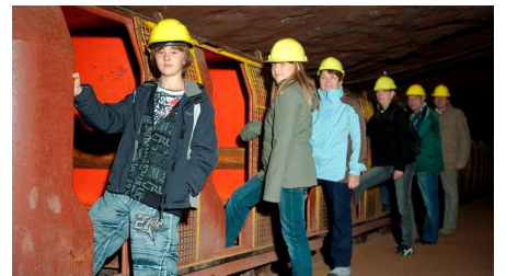
Besucherbergwerk Kleinenbremen - © Besucherbergwerk Kleinenbremen