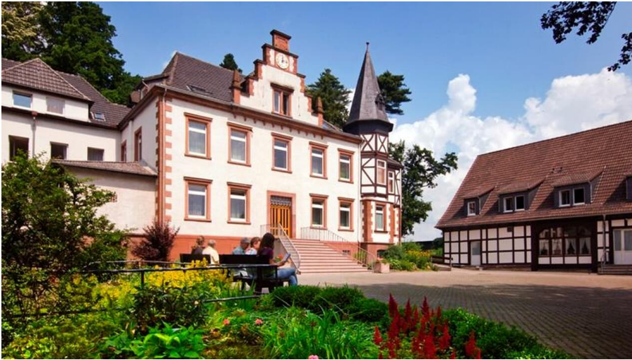
Serviam Schwestern von Warburg-Germete