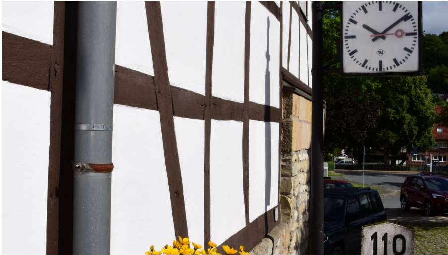
Eggemuseum | Altenbeken