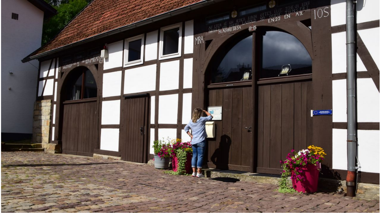
Eggemuseum | Altenbeken