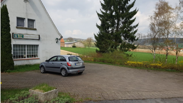
Parkplatz am Haus Sonnenblick