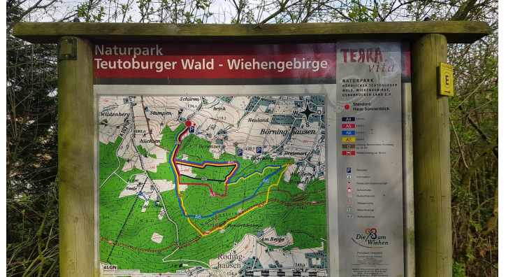
Informationstafel am Wanderparkplatz Haus Sonnenblick