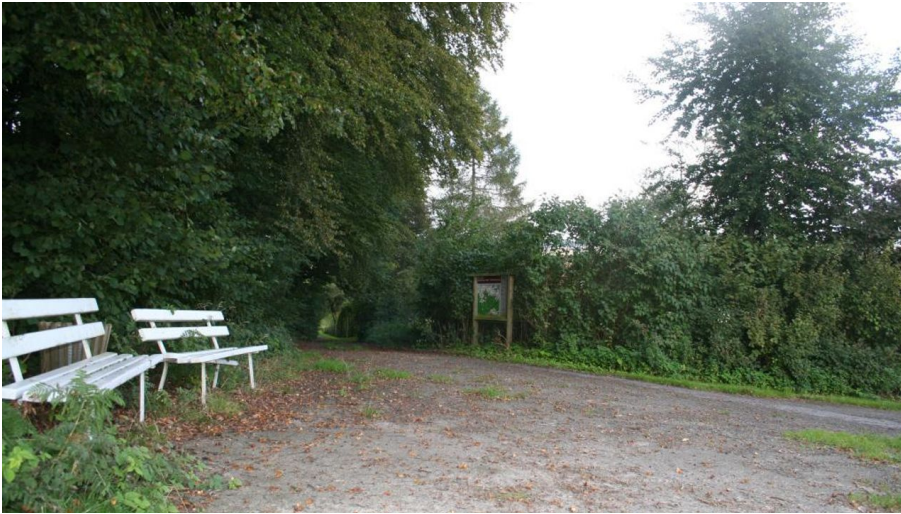
Wanderparkplatz "Haus Sonnenblick"