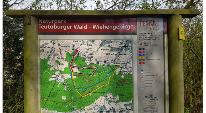
Informationstafel am Wanderparkplatz Haus Sonnenblick