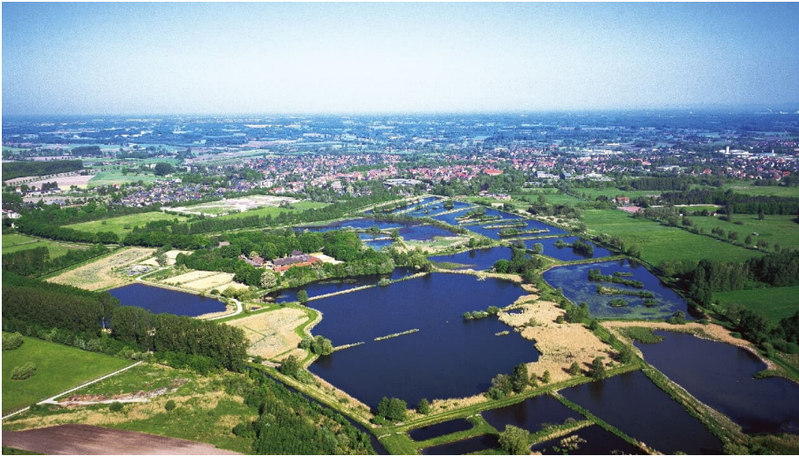
Naturschutzgebiet Rietberger Fischteiche