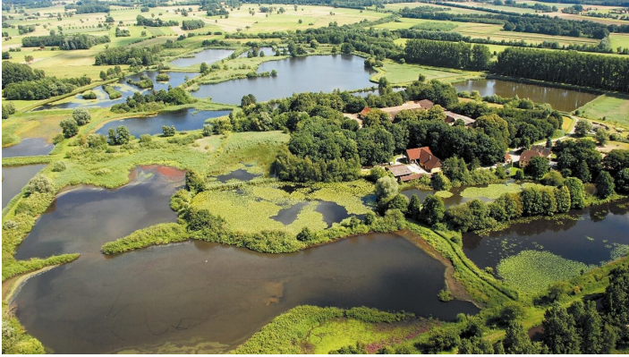
Naturschutzgebiet Rietberger Fischteiche