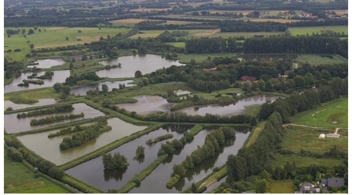
Naturschutzgebiet Rietberger Fischteiche