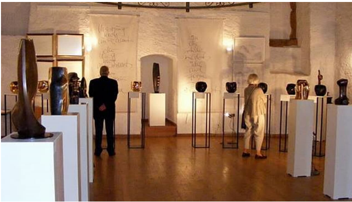
Wechselnde Kunstausstellung in der Burg Dringenberg