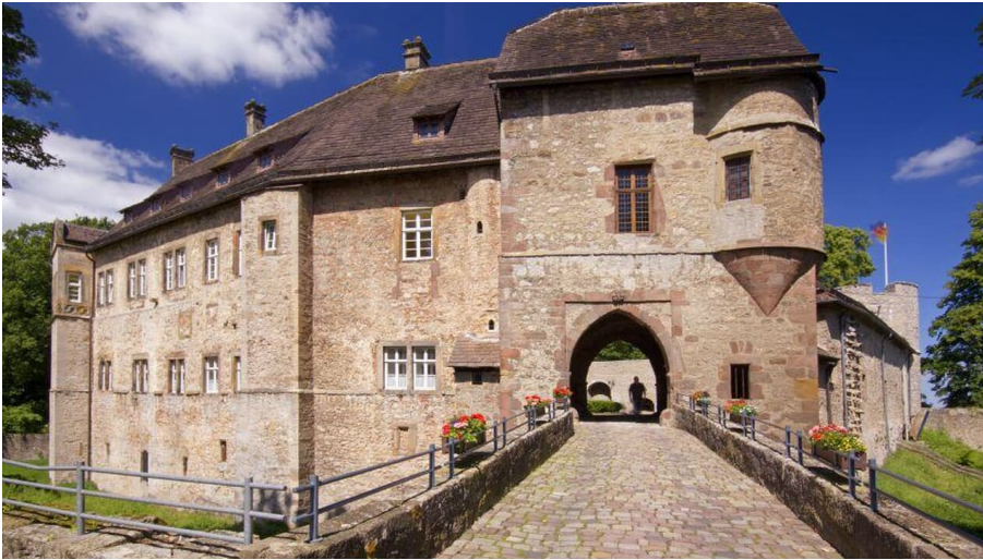
Burg Dringenberg