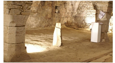
Großer Gewölbekeller in der Burg Dringenberg