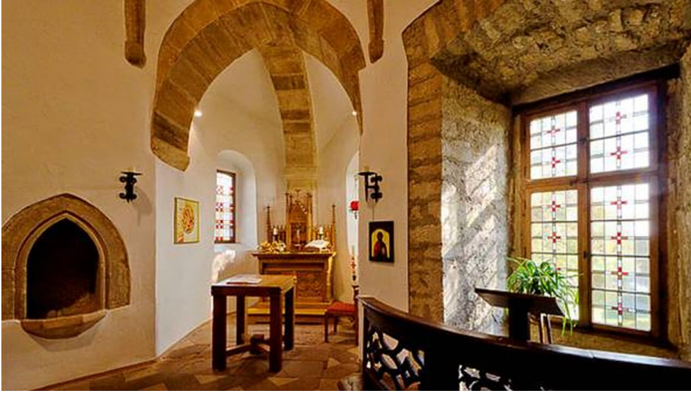
Burgkapelle in der Burg Dringenberg - © Heimatverein Dringenberg