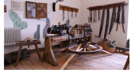
Drechselstube in der Burg Dringenberg