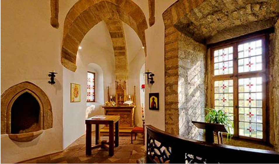
Burgkapelle in der Burg Dringenberg