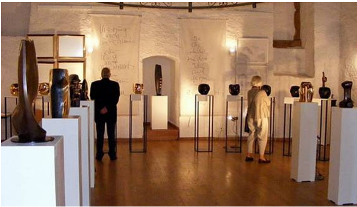
Wechselnde Kunstausstellung in der Burg Dringenberg