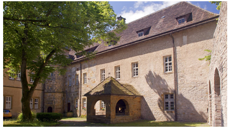
Innenhof Burg Dringenberg