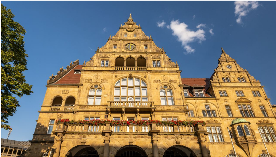
Bielefeld-Altes Rathaus-Teutoburger-Wald-Tourismus-D-Ketz-077-CC-BY-SA.jpg