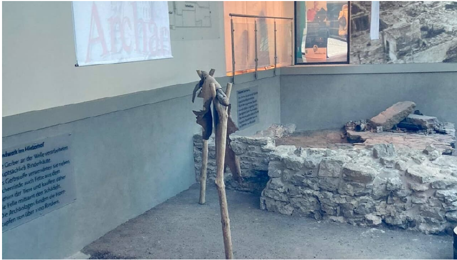
Ausgrabungen Archäo Welle