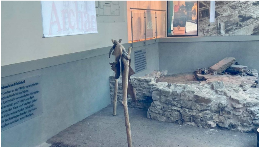
Ausgrabungen Archäo Welle