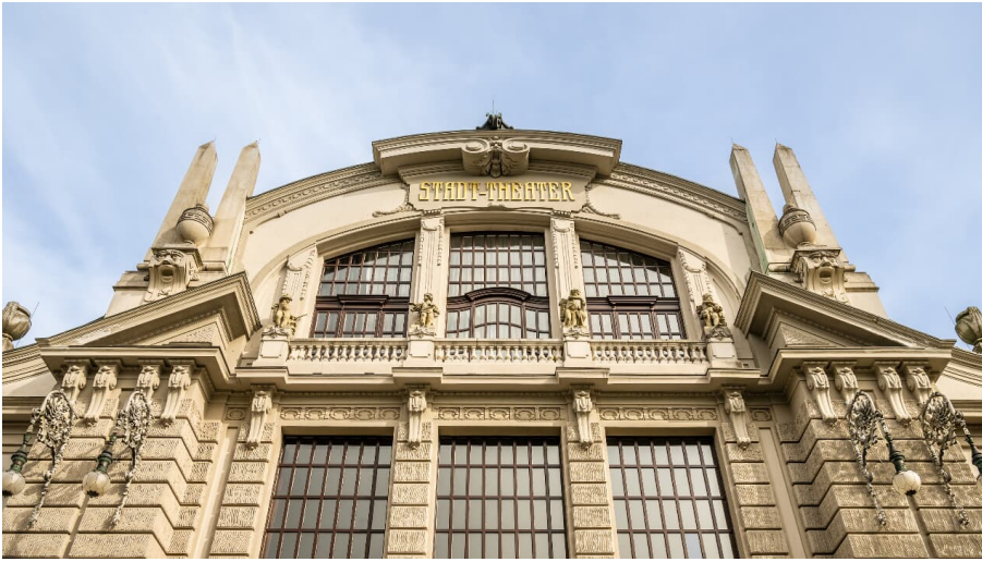
Bielefeld-Theater Bielefeld-Teutoburger-Wald-Tourismus-D-Ketz-094-CC-BY-SA.jpg