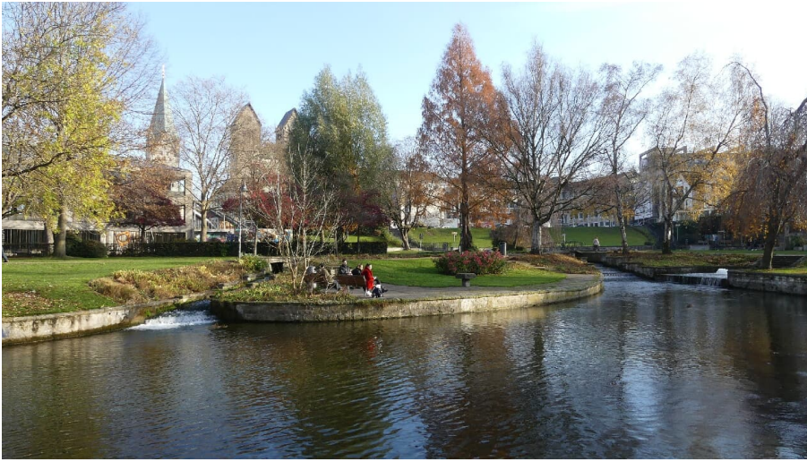
Westliches Paderquellgebiet