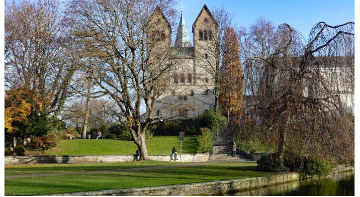
Quellbecken der Börnepader und Abdinghofkirche