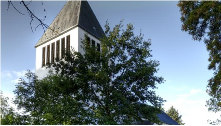
Kath. Kirche St. Heinrich 1