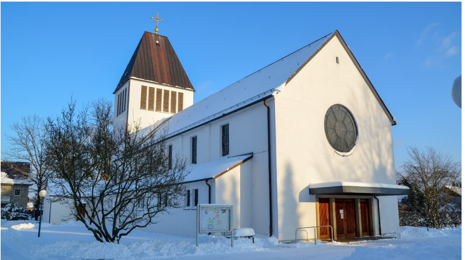
Verschnete St-Heinrich-Kirche im Ortsteil Sende in Schloß Holte-Stukenbrock