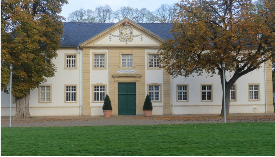
Ehemaliger Marstall (Teilansicht)