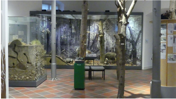
Naturkundemuseum - Innenansicht - © Karl Heinz Schäfer, Tourist Information Paderborn