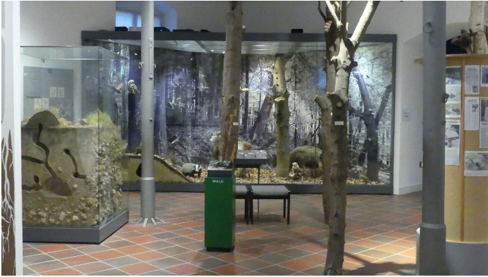
Naturkundemuseum - Innenansicht