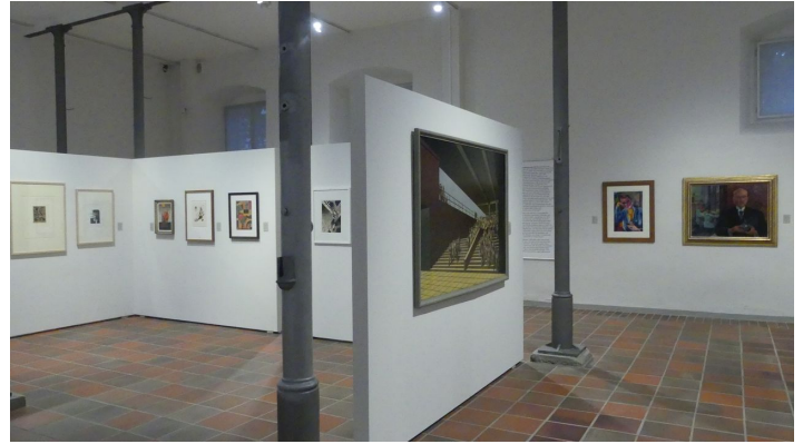
Kunstmuseum - Innenansicht