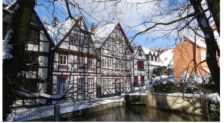
Fachwerkhäuser Auf den Dielen - Winterbild