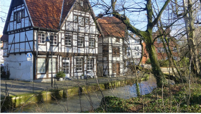
Fachwerkhäuser Auf den Dielen - © Karl Heinz Schäfer, Tourist Information Paderborn / Verkehrsverein Paderborn e.V.