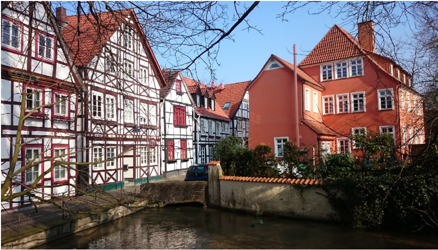
Fachwerkhäuser auf den Dielen