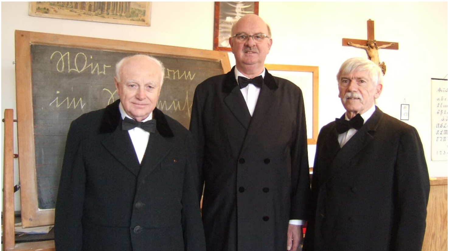
Dorfschullehrer im Dorfschulmuseum