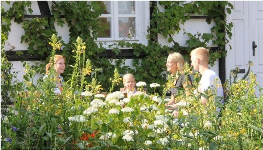
Im Garten des Dorfschulmuseums