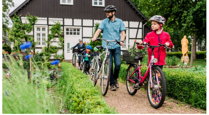
Thorsten-Hennig-Fotografie-Fahrradtouren-Hövelhof-2019- A9_06174.jpg