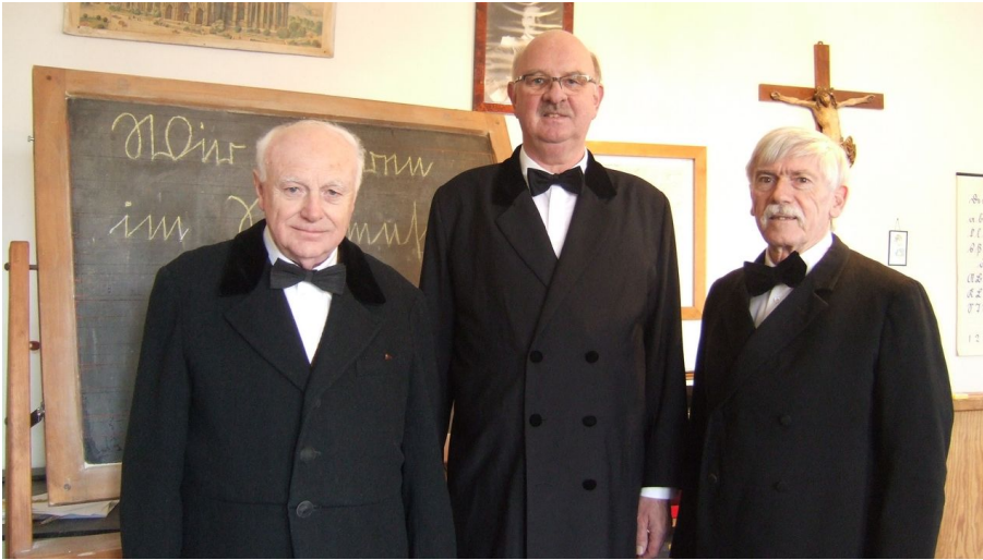
Dorfschullehrer im Dorfschulmuseum