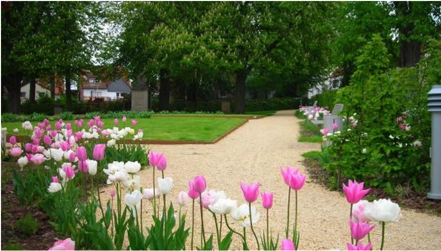
Groene Plaats