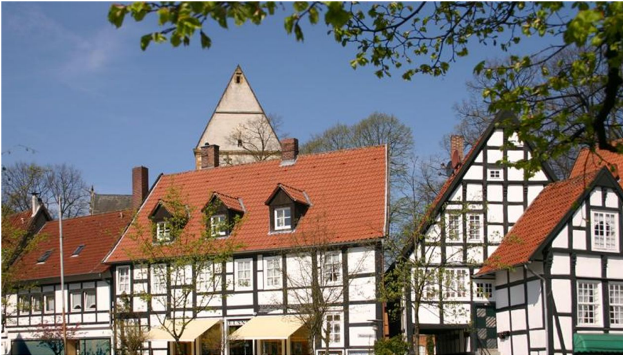
Halle Westfalen, Kirchplatz "Haller Herz"