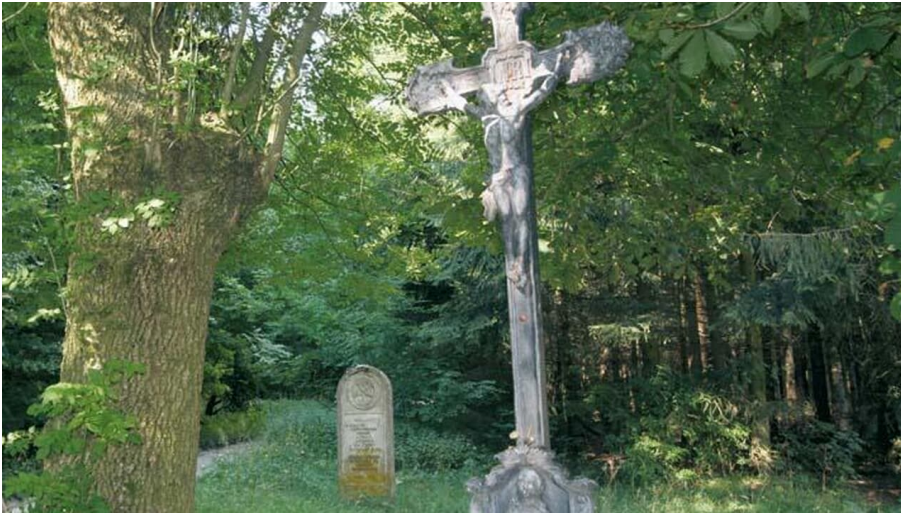
Hindhals Kreuz Lippspringer Wald - © Thomas Fischer, Tourist-Information Bad Lippspringe