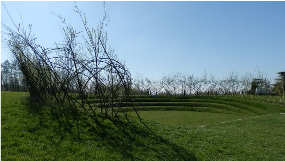
Skulpturenpark Lengerich