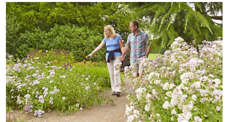
Skulpturenpark Lengerich - Jones Garten II