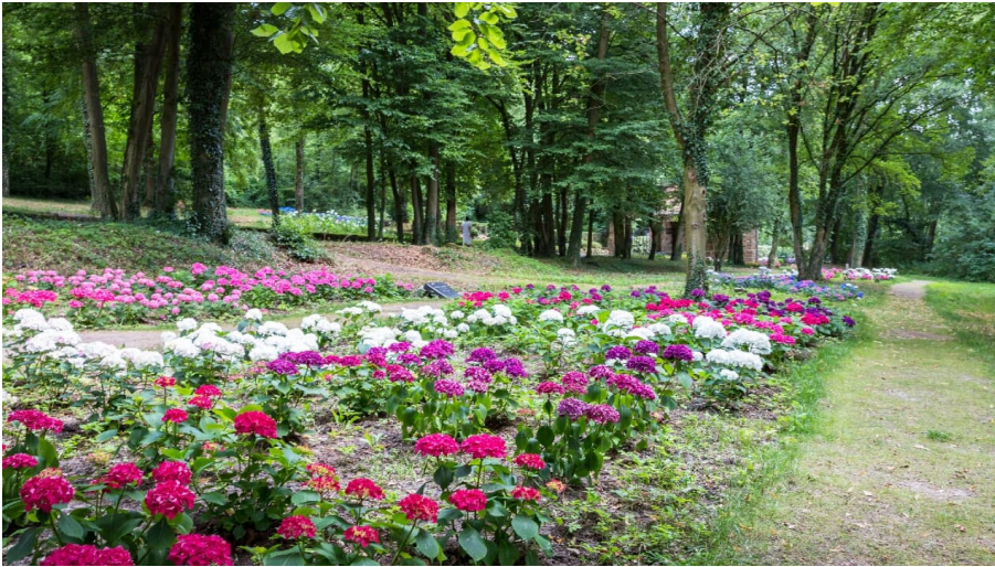
Hortensia Garden im Skulpturenpark Lengerich