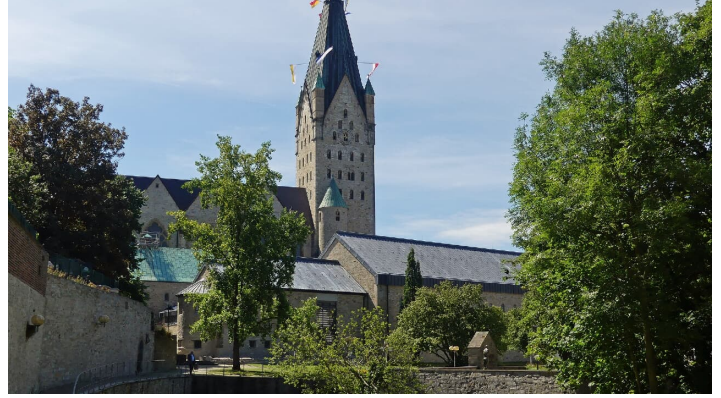
Dielenpader und Dom - © Karl Heinz Schäfer, Tourist Information Paderborn / Verkehrsverein Paderborn e.V.