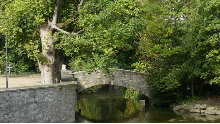
Brücke über die Dielenpader