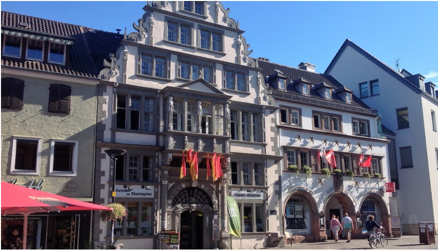
Heisingisches Haus und Tourist Information