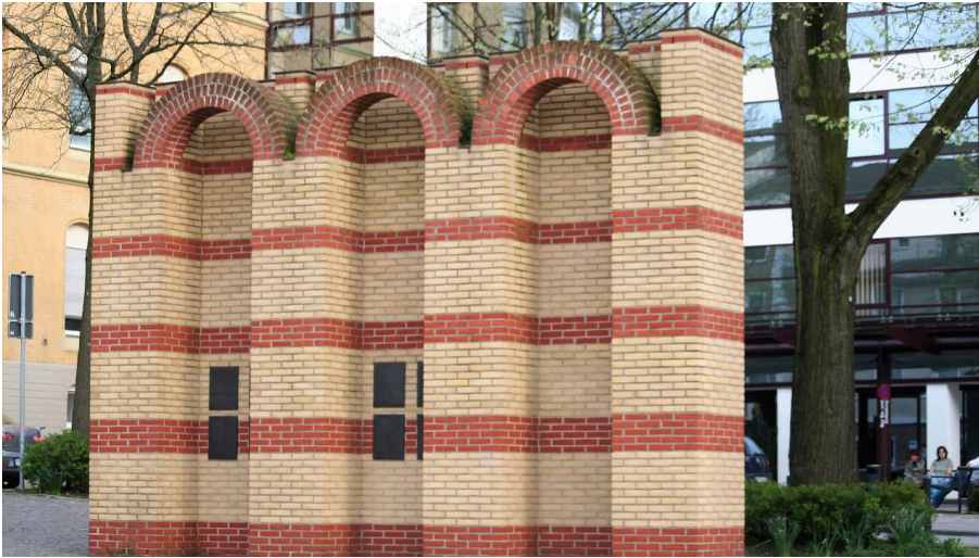
Jüdisches Mahnmal - © Karl Heinz Schäfer, Tourist Information Paderborn